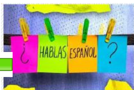
IMMERSION EN ESPAGNOL