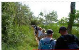
MARCHE DU MERCREDI